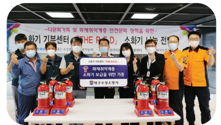
『THE R.E.D』소화기 나눔 전달식