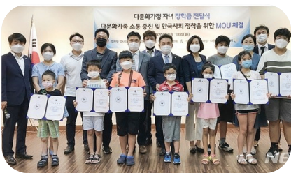
다문화가정 정착지원 MOU 체결