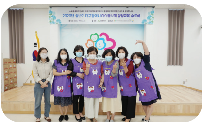
하반기 아이돌봄비 양성교육