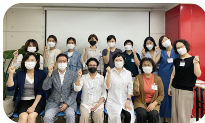
오바마스피치학원 MOU체결 (결혼이주여성 다문화 이해교육 강사양성)